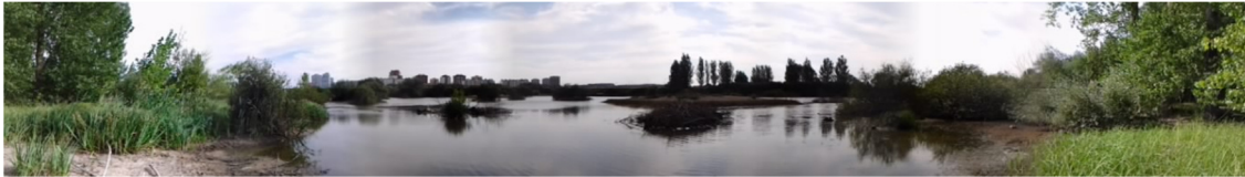
Panorámica del humedal.