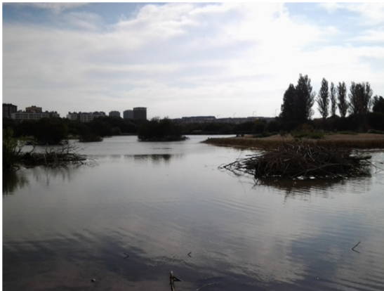
Vista de mota artificial y restos de vegetación.