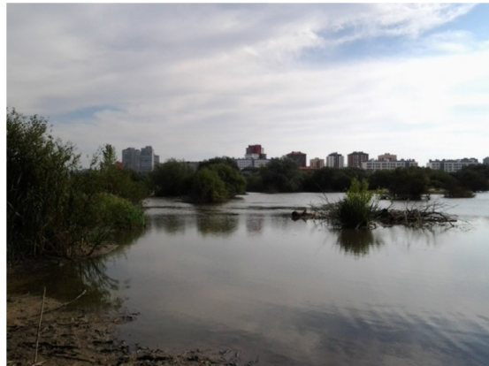
Vista del litoral con la ciudad de Vitoria al fondo.