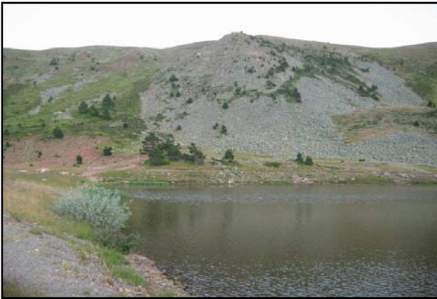
Vista de la zona litoral de la laguna