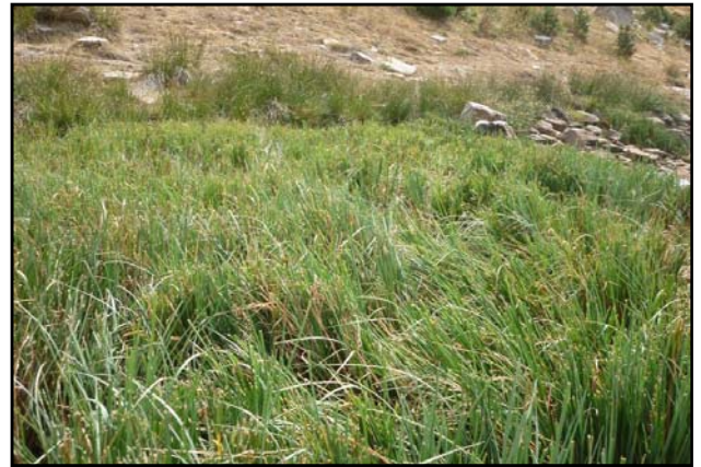
Efectos del ganado sobre la vegetación litoral