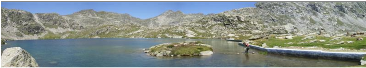
Vista general del Estany Neriolo en 2009