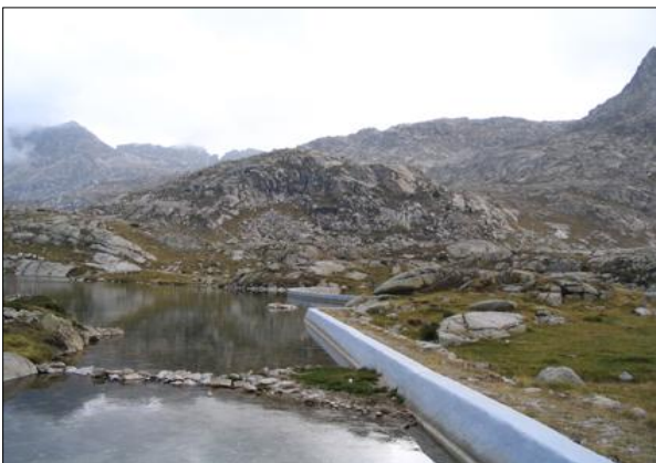
Imagen de la presa presente en el lago