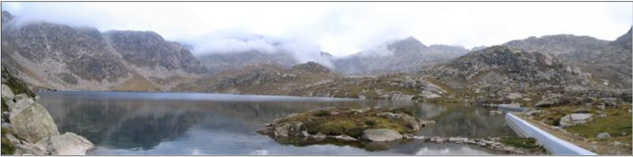
Vista general del Estany Neriolo en 2007